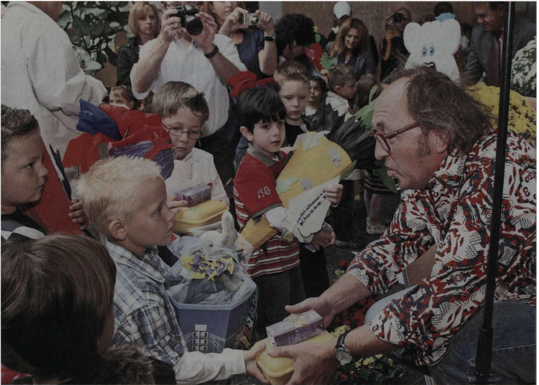
Einsatz für gesunde Ernährung: Urban Priol überreicht den Erstklässlern der Aschaffener Hefner-Alteneck-Schule Bio-Brotboxen.